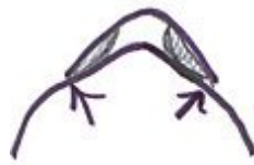
För smal bomvidd